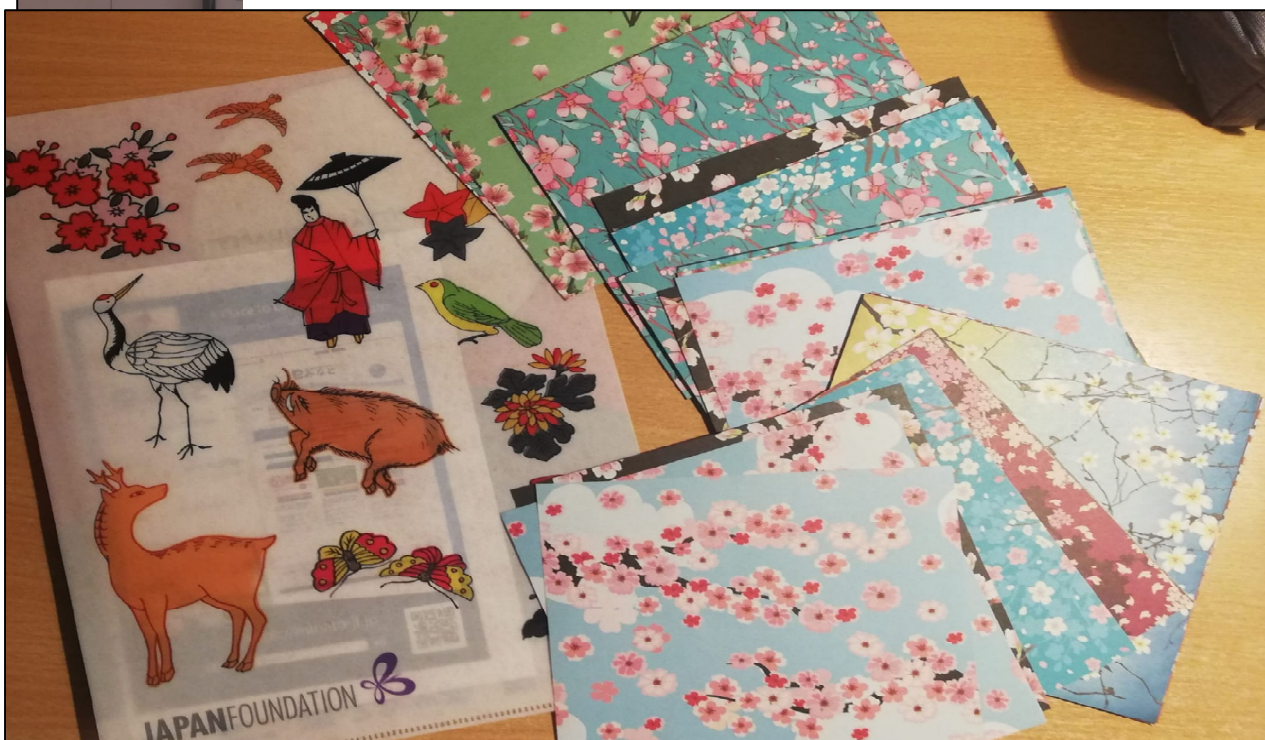
Оригами примерци ждрала и кутије, направљени од стране госпође Јошиоке