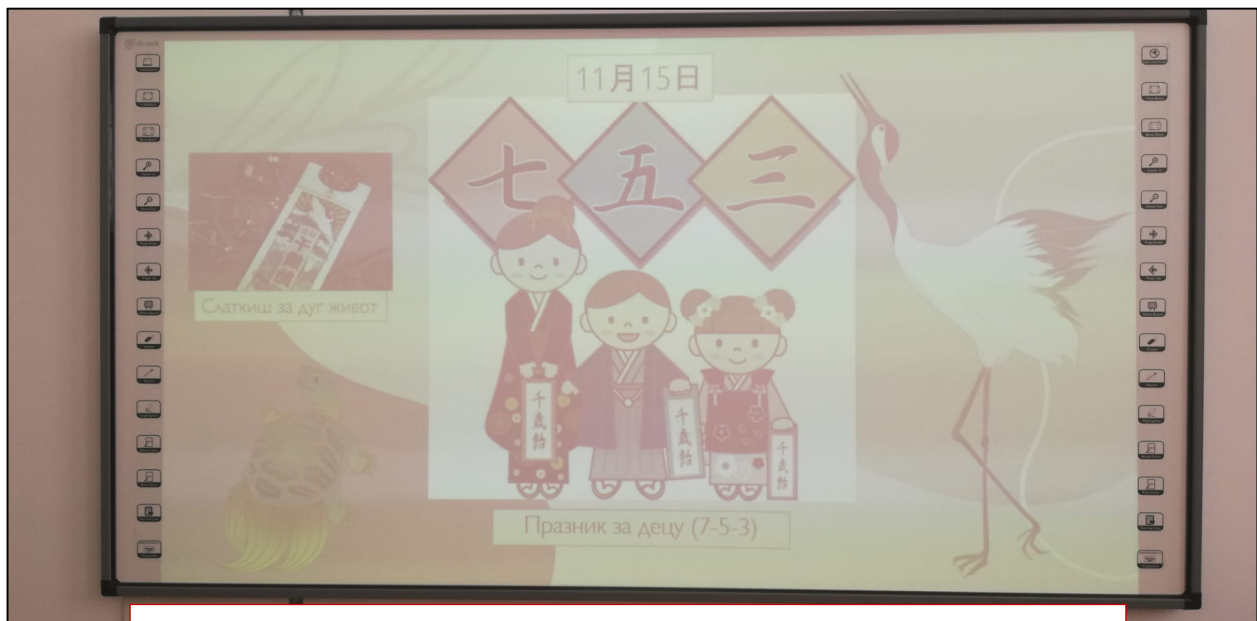
Презентација о бројевима. Слајд о јапанском празнику за децу

У наставку можете видети у пар фотографија саму атмосферу, али и радове које нам је госпођа Ћисато оставила као успомену.